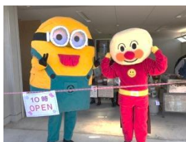
ミニオンとアンパンマンが来てくれたよ☆