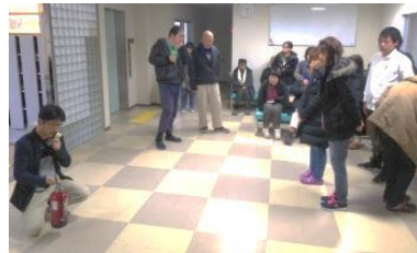
(消火器の使い方を説明中)

今回は上着を着て避難をする、という訓練をしました。職員の指示のもと、みなさん落ち着いて上着を着て速やかに避難することができました。また、通報の仕方、消火器の使い方をみんなで確認しました。