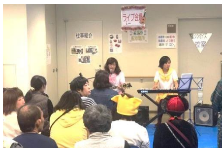
シンセイズのライブ