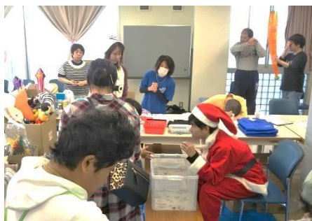
ゲームコーナーの様子